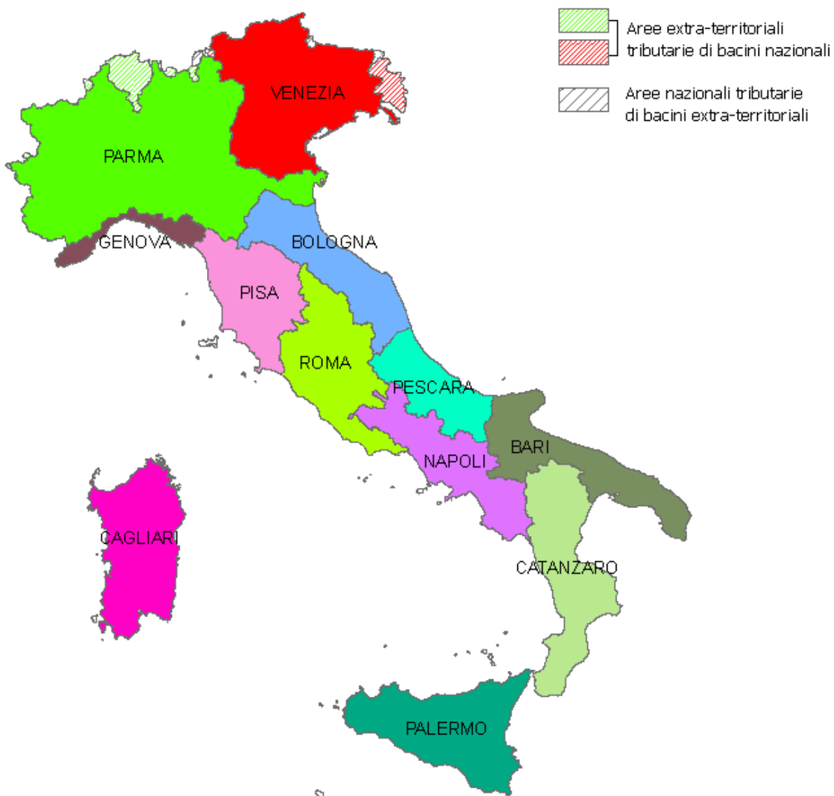
Figura 1 – Scenario I