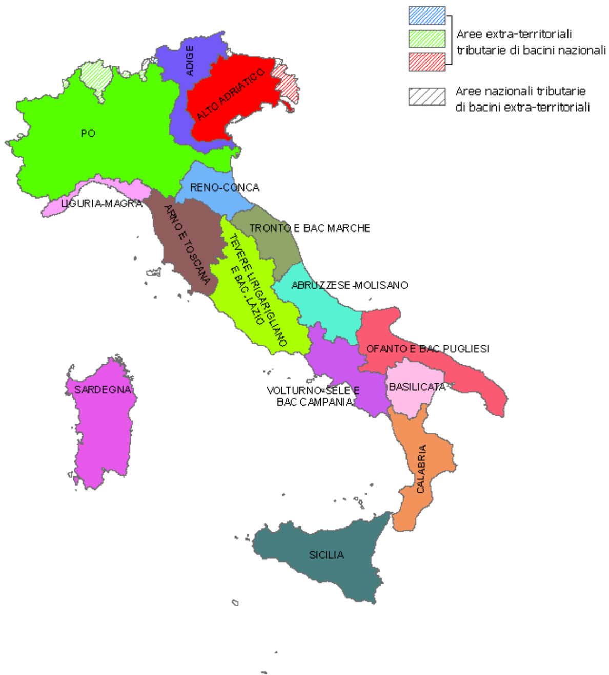
Figura 3 – Variante allo scenario II