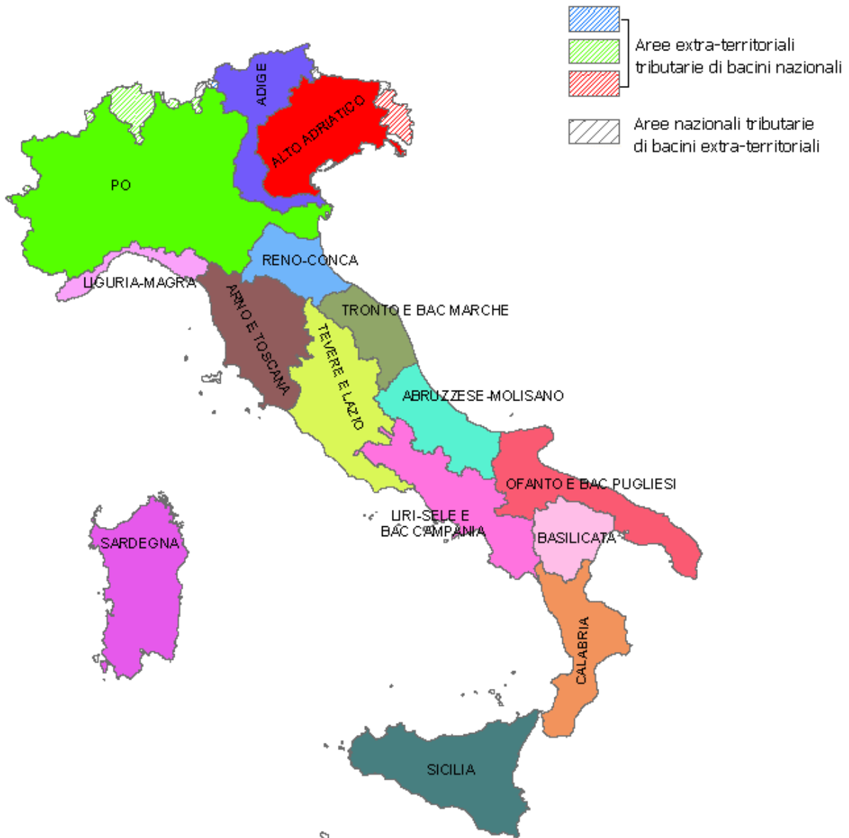
Figura 2 – Scenario II

Un secondo scenario possibile può essere quello di associare i Distretti di Bacino alle Autorità di Bacino Nazionali previste dalla legge 183 del 1989 e accorpare le Autorità di bacino interregionali e regionali previsti dalla stessa legge nel rispetto delle indicazioni della Direttiva. Tale soluzione appare di impatto minimale rispetto alle strutture esistenti in quanto si tratta di aggregazioni di bacini previste dalla stessa L.183/89 (es. Bacini delle Marche), in pochi altri casi sono state effettuate delle aggregazioni, non sostanziali, sempre tra bacini contigui (es. Bacino interregionale del Reno insieme ai Bacini regionali della Romagna). Con tale soluzione vengono individuati 15 Distretti Idrografici.